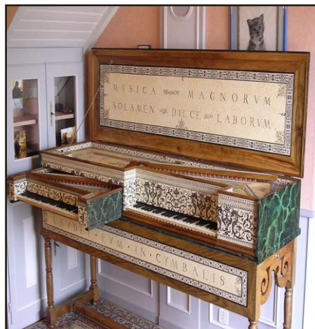
Muselar La mère et l'enfant (l'enfant découvert)