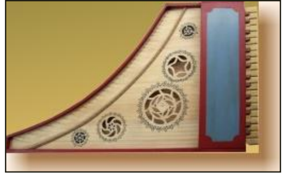
Source : le clavichordum (XIVe)