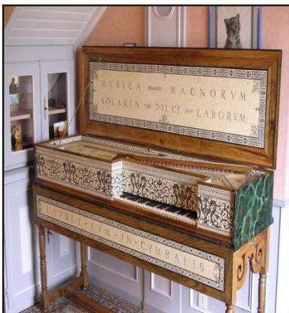
Muselar La mère et l'enfant (avec l'enfant caché)