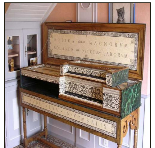
Muselar La mère et l'enfant (l'enfant sur la mère)