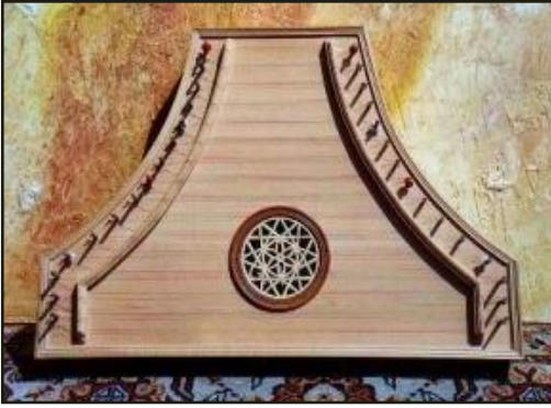
L'origine : le Psaltérion (Moyen-âge)